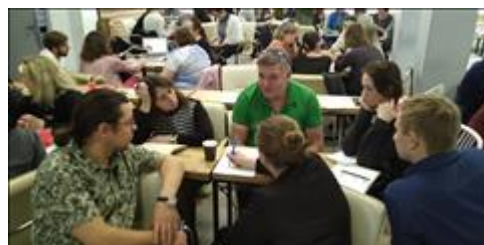
Модуль 2.1. Контент-Стратегия работа в малых группах