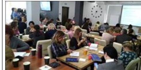
Модуль 3.1. Копирайтинг участники