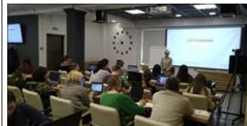
Модуль 1.1. Сегментация участники