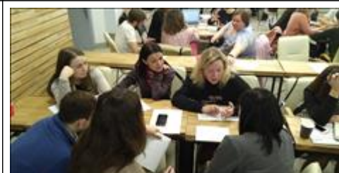
Модуль 2.1. Контент-Стратегия участники