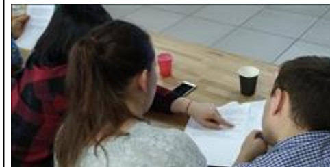
Модуль 3.2. Копирайтинг. Практика работа с куратором в малой группе

Электронные версии материалов (бюллетеней, брошюр, буклетов, газет, докладов, журналов, книг, презентаций, сборников и иных), созданных с использованием гранта в отчетном периоде (при условии, что такие материалы не содержатся в материалах, указанных в подпункте 5 настоящего пункта)