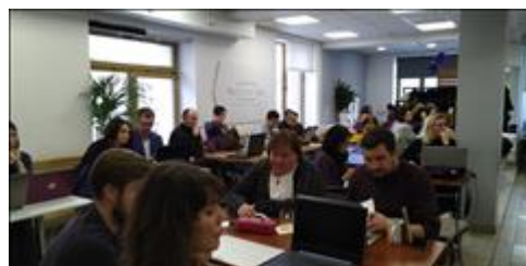
Модуль 1.1. Сегментация участники