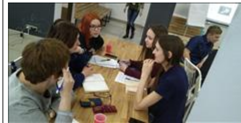
Модуль 2.2. Контент-Стратегия. Практика работа с куратором в малой группе