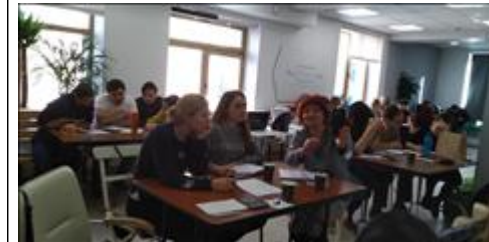
Модуль 3.1. Копирайтинг участники