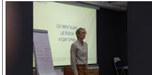
Модуль 1.2. Сегментация. Практика вопрос-ответ участников к кураторам