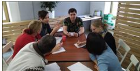
Модуль 2.2. Контент-Стратегия. Практика работа с куратором в малой группе