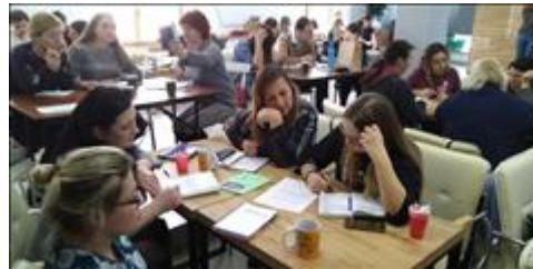
Модуль 3.1. Копирайтинг работа в малых группах, пишем тексты