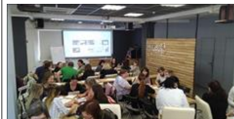
Модуль 2.1. Контент-Стратегия лекции