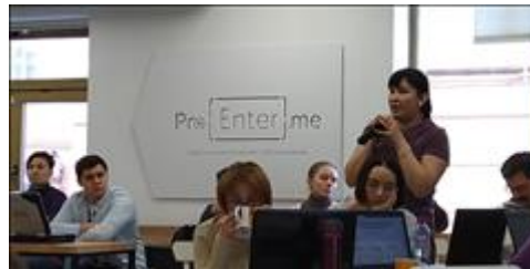
Модуль 1.2. Сегментация. Практика вопрос-ответ участников к кураторам