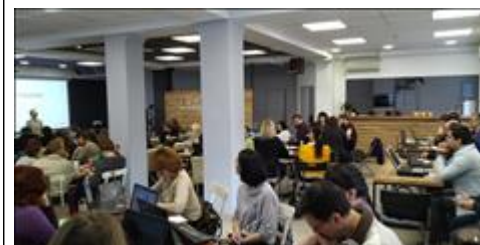
Модуль 1.1. Сегментация участники