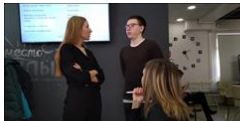
Модуль 3.2. Копирайтинг. Практика работа с куратором