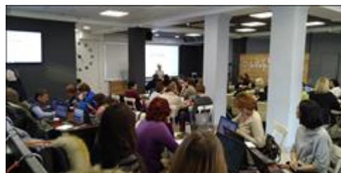
Модуль 1.1. Сегментация участники обучения

Информация, указанная Вами в данном поле отчета, будет доступна для посетителей сайта Фонда президентских грантов (в том числе представителей СМИ)